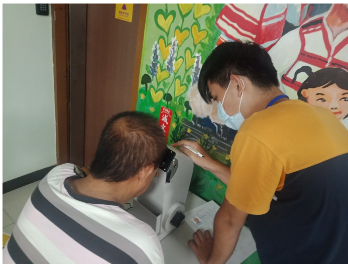
照片說明:協助民眾體檢(測視力)