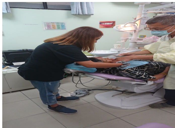
照片說明:協助牙科醫師小助手