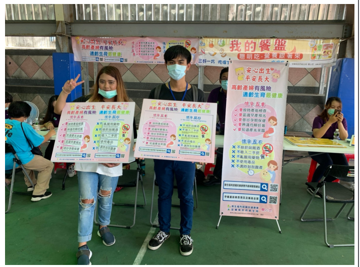
照片說明：至本鄉敬老活動衛教宣導