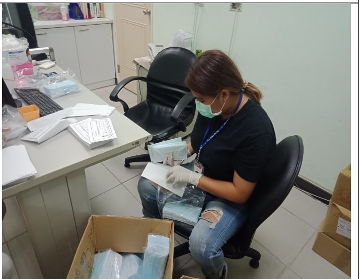
照片說明：協助分裝口罩