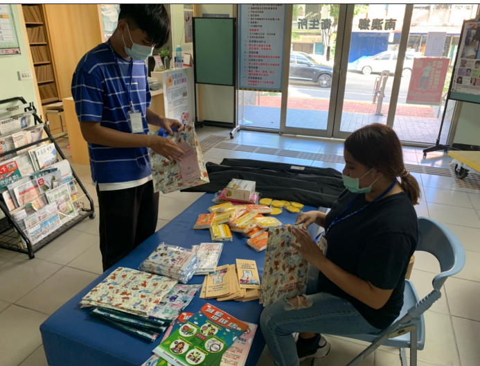
照片說明：協助宣導用物及單張分裝