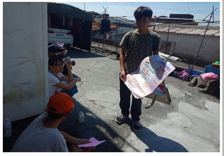
照片說明：至各村宣導村民參與衛生所之檢查活動