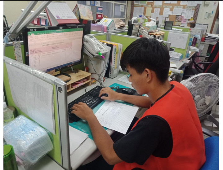
照片說明:協助整理電腦文件