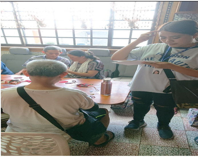
照片說明：至各村確認參與活動之名單