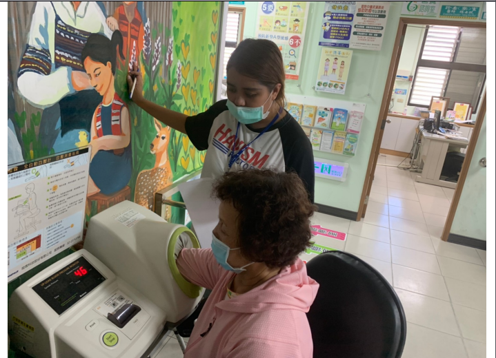
照片說明:協助民眾測量血壓