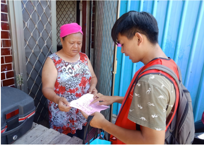
照片說明：家訪衛生所之檢查活動通知