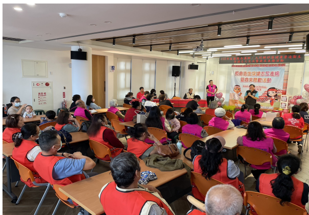
志工表揚暨歲末聯歡活動~游議員感謝致詞