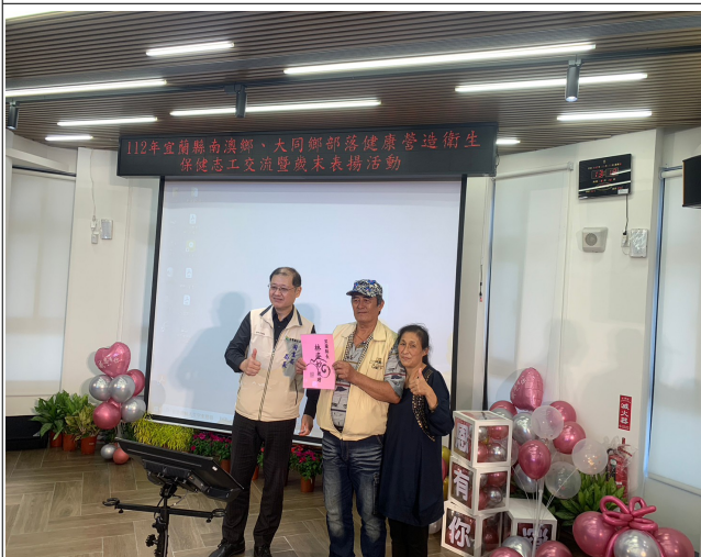
志工表揚暨歲末聯歡活動~摸彩(縣長獎)