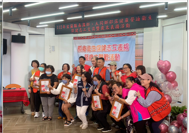
志工表揚暨歲末聯歡活動~志工表揚頒獎花絮