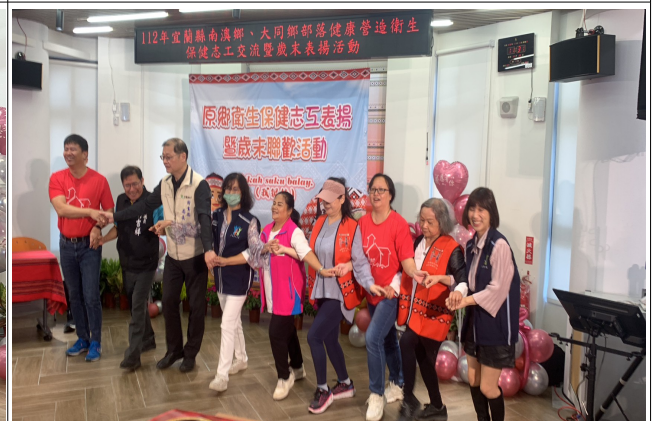
志工表揚暨歲末聯歡活動~泰雅舞動