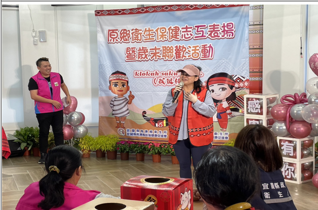
志工表揚暨歲末聯歡活動~部促會理事長勉勵