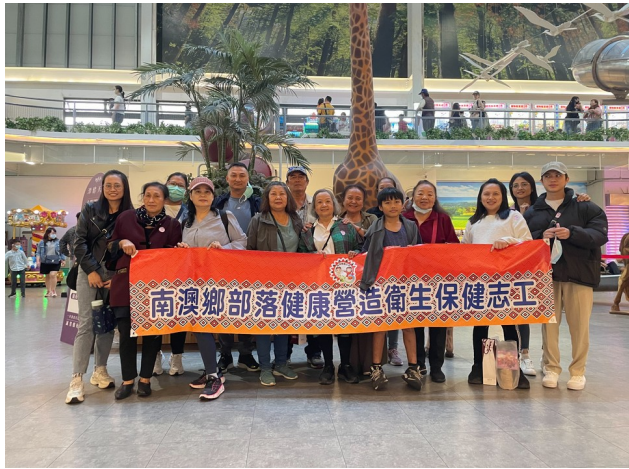
志工踏青~潭醇天地